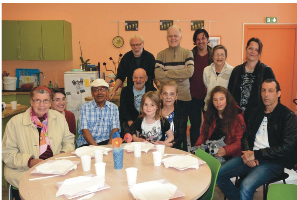
L'accueil du dimanche matin « Bonjour dimanche ! »