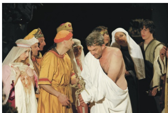
Ceux qui avaient arrêté Jésus l'amènèrent devant Caïphe, le grand prêtre (Matthieu 26, 57)

Ainsi commence le livre de prières pour les défunts : le mystère pascal ! Voilà une expression quelque peu énigmatique qui peut nous étonner et nous surprendre. Pourtant, que de fois vous m'avez entendu la prononcer quand je célèbre les enterrements !