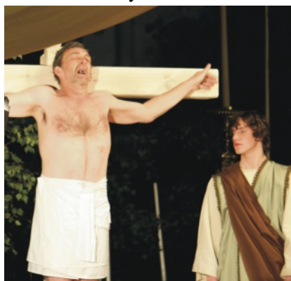
Jésus, poussant de nouveau un grand cri, rendit l'esprit. (Matthieu 27, 50)

nous ; le Christ ressuscite – il faut le dire – avec nous et pour nous. Un mystère ? Non pas au sens de quelque chose que l'on ne comprendrait pas et qui nous serait inaccessible, mais au sens d'un don insensé, le don de l'amour d'un Dieu qui est allé jusqu'à l'extrême de l'amour en nous donnant sa vie pour qu'à notre tour nous soyons des vivants.